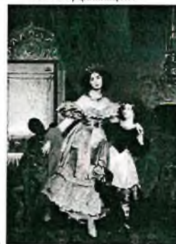
8. Карл Брюллов «Ю.П. Самойлова с воспитанницей и арапчонком»