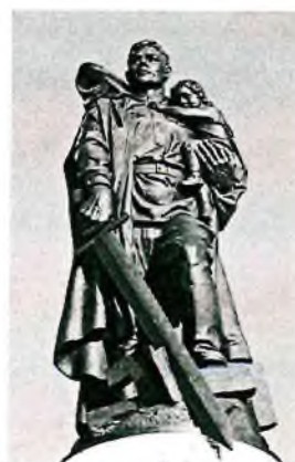
3. Солдат с ребенком