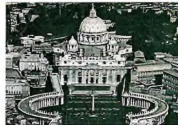
Таблица к заданию 5