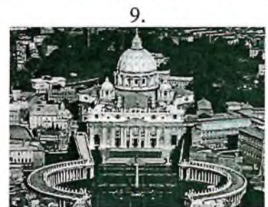
Таблица к заданию 5