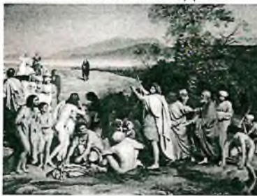
7. Дмитрий Иванов « Явление Христа народу »