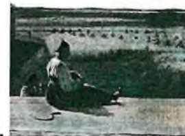
9. Алексей Венецианов « Отдых после жатвы »