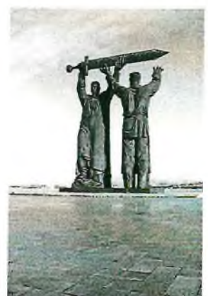
4. Два солдата