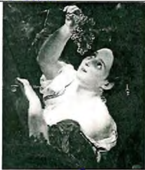
4. Василий Тропинин «Итальянский полдень»