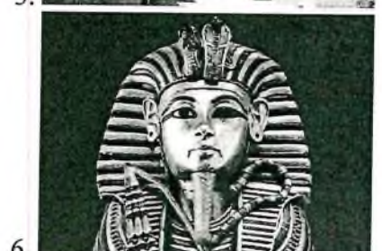
Таблица к заданию 1.