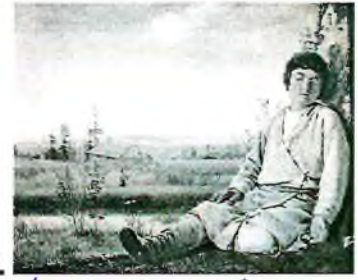
3. А. Винников «Спящий пастушок»