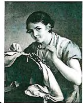
6. Василий Тропинин «Вышивальщица»