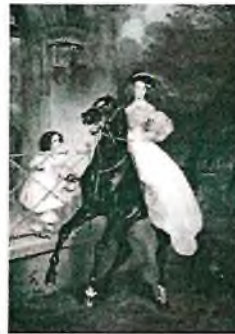
5. Василий Тропинин «Всадница»