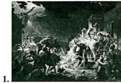
1. Александр Брюллов « Последний день Помпеи »