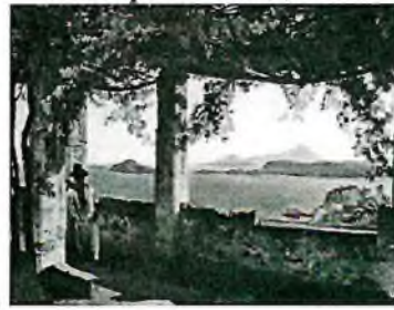
2. Сильвестр Щедрин «Террасы в Сорренто»